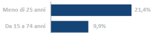
Tasso di disoccupazione per età, dicembre 2014 Area UE-28

Negli ultimi 20 anni CSR Europe e il suo Network di 42 Organizzazioni Partner Nazionali sono stati capaci di far crescere l'importanza della sostenibilità come un'opportunità per le imprese, di promuoverne l'integrazione nelle strategie e nei processi gestionali delle 10.000 e più imprese aderenti. Questo impegno concreto sarà ulteriormente rafforzato e indirizzato verso forme di collaborazione ancora più efficaci ed innovative nei prossimi 5 anni.