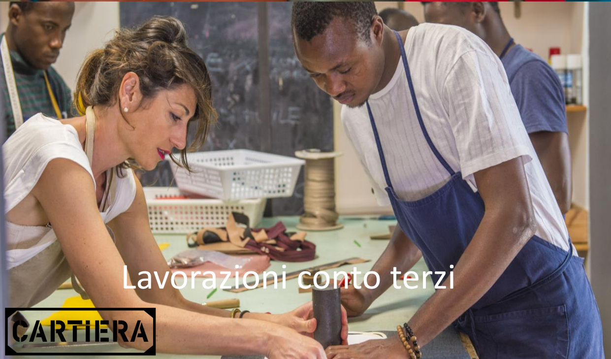
Lavorazioni conto terzi