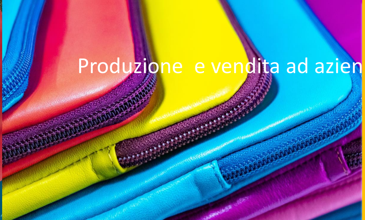
Produzione e vendita ad aziende